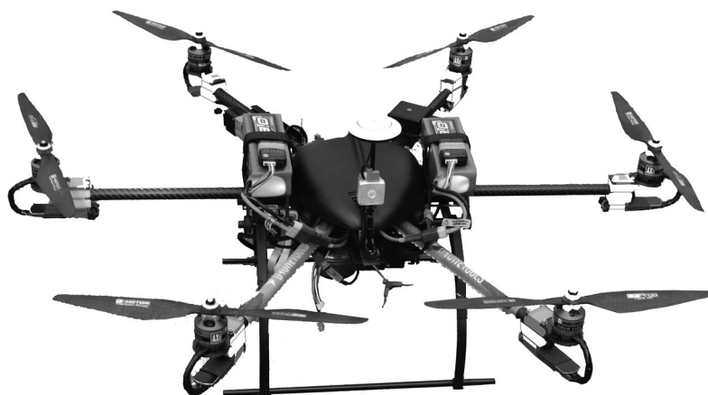
Figura 1. Hexacóptero fabricado por Dronetools, España (usado para generar las imágenes de este trabajo).

De acuerdo con Van Blyenburgh (2013), las diferencias generales por tipo de VANTs, con fines de monitoreo remoto, son las siguientes, expresadas en peso, autonomía y carga por peso (cuadro 1).