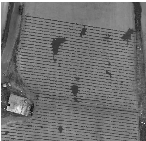
Figura 4. Ortomosaico generado de fotografías tomadas desde un VANT tipo hexacóptero durante la aplicación del primer riego, usando un sistema de riego por goteo.

se han utilizado imágenes de satélite para la estimación de la evapotranspiración de referencia y necesidades hídricas de los cultivos en los ámbitos regional o nacional (Vuolo D'Urso, De Michele, Bianchi, & Cutting, 2015). Sin embargo, su uso parcelario es restringido por la limitada resolución espacial y temporal de las imágenes satelitales, así como las observaciones termales y la complejidad de los algoritmos para implantar procedimientos operacionales en tiempo real.