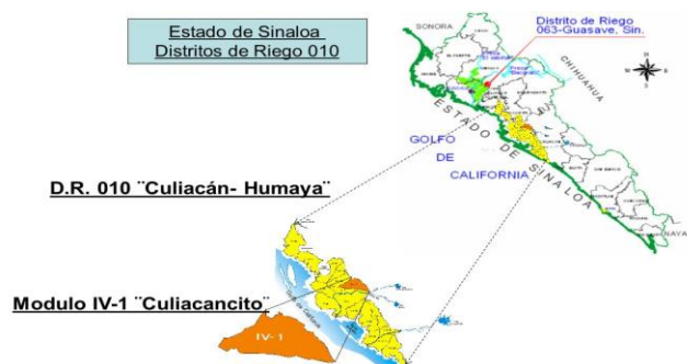
Figura 1. Ubicación geográfica del Módulo de Riego IV-1 “Culiacancito” A.C. en Sinaloa.

La Asociación de Usuarios Productores Agrícolas “Culiacancito”, Módulo de Riego IV-1 A.C., se encuentra localizado al Poniente de la Cd. de Culiacán, en parte de los Municipios de Culiacán y Navolato en el Estado de Sinaloa, en el área de influencia de la IV Unidad, del Distrito de Riego No. 010 Culiacán-Humaya, Sinaloa. Cuenta con una superficie física total de 15,863.02 hectáreas, de las cuales son irrigadas 15,355.28 ha., de estas 8,913.85 pertenecen a 1,215 usuarios del sector social, que en promedio explotan una superficie de 7.33 has., y 6,441.43 has. Son de 413 productores del sector particular, que poseen en promedio 15.59 has., y en general a nivel de Módulo de riego la superficie media por usuario es 9.43 ha. Cuenta con 7 secciones de riego y tiene una proporción en cuanto a la distribución de la tierra por sector, del 58.05 % para el ejidal y el restante 41.95 % para el particular.